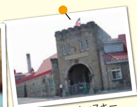
ニッカウイスキー